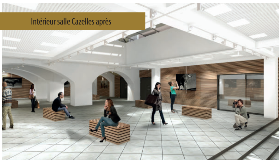
Intérieur salle Cazelles après