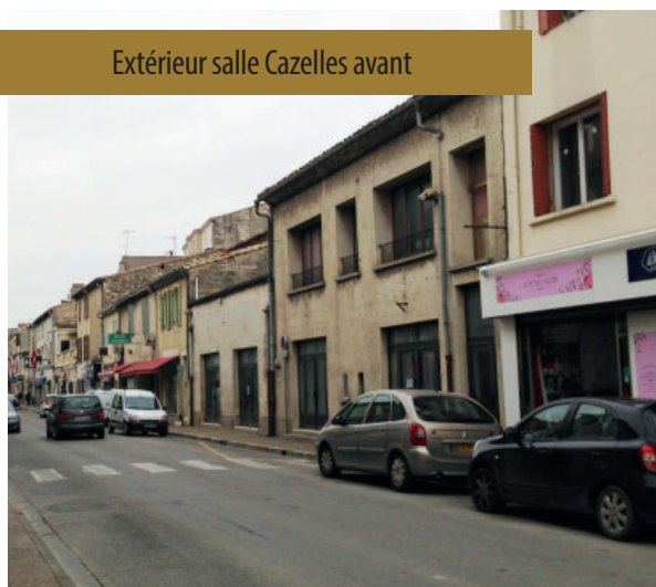
Extérieur salle Cazelles avant