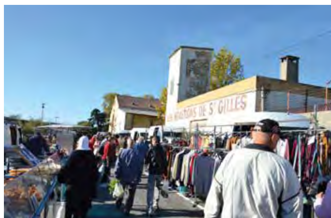
Avec l'arrivée des industriels forains et les travaux sur l'avenue Cazelles, les marchés du jeudi et du dimanche matins ont été déplacés sur le port, côté cave coopérative. Merci aux étaliers et aux consommateurs qui ont fait preuve de bonne volonté pour ce déménagement inédit.