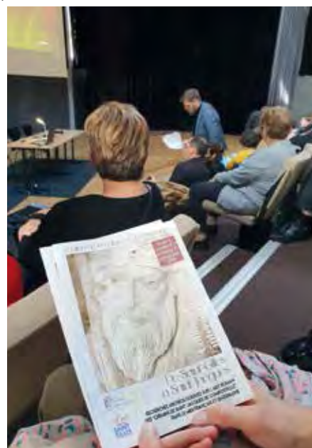
Dans le cadre de l'anniversaire des 20 ans d'inscription à l'Unesco, le service patrimoine a organisé un colloque scientifique d'experts sur l'art roman à travers le monde.