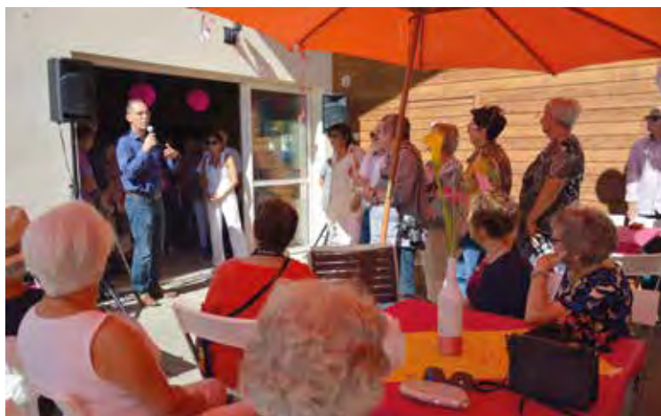
Des retraités comblés aux Senioriales qui fêtaient cette année leurs 10 ans en présence du maire, de la directrice de la médiathèque et de l'association des commerçants Saint-Gilles cœur de ville.