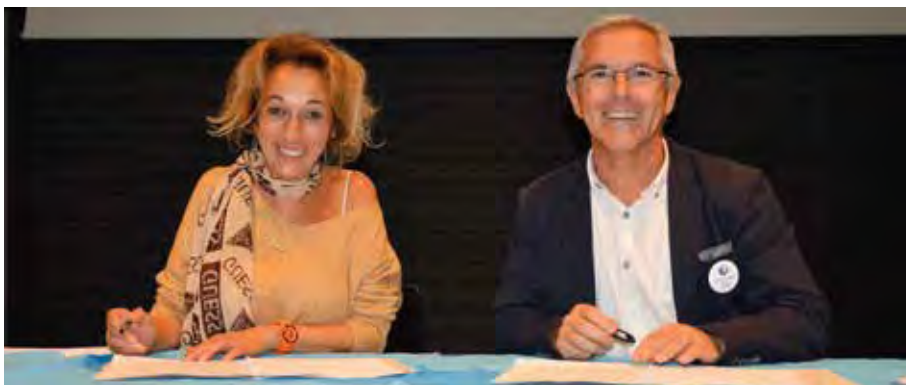
Signature joyeuse de convention entre la Ville et le directeur de Pôle Emploi 7 collines