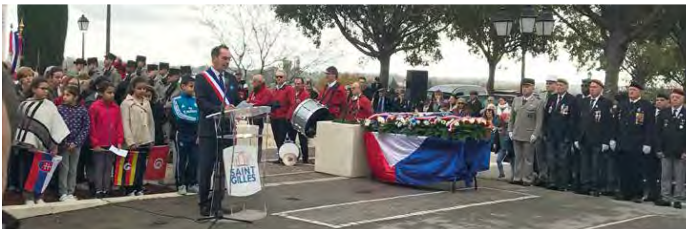
Cette année, la commémoration de l'armistice de la première guerre mondiale était particulière car on célébrait le centenaire de la fin de combats particulièrement meurtriers. La Ville de Saint-Gilles a rendu hommage à tous ceux qui se sont battus pour la France, et plus particulièrement les Poilus saint-gillois, mis à l'honneur par les enfants de la ville (lire aussi en page Education).