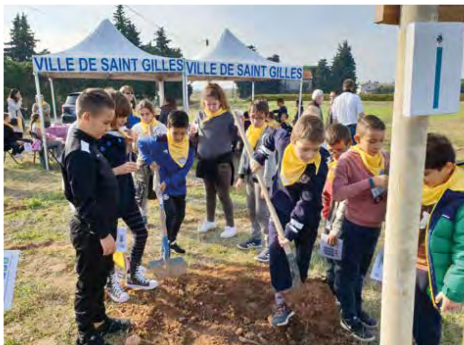
20 arbres pour 20 ans, c'est l'événement imaginé par l'association Accueil et Traditions, en partenariat avec la Ville, pour fêter l'inscription à l'Unesco. Au terme d'une déambulation sur le GR 653 vers Saint-Jacques-de-Compostelle, les enfants des écoles, les retraités, et même le maire et ses adjoints, se sont prêtés au jeu. Désormais, 10 sophoras et 10 micocouliers supplémentaires vont offrir de l'ombre aux pèlerins.