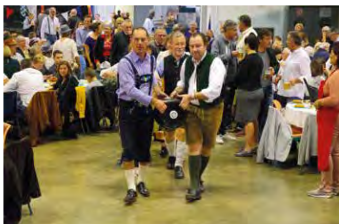
Grand moment de fraternité et d'échanges avec nos jumeaux de la ville allemande d'Abensberg. La salle polyvalente Robert-Marchand était comble pour la Fête de la bière...où le maire a fait un discours en allemand ! (vidéo sur notre page Facebook)