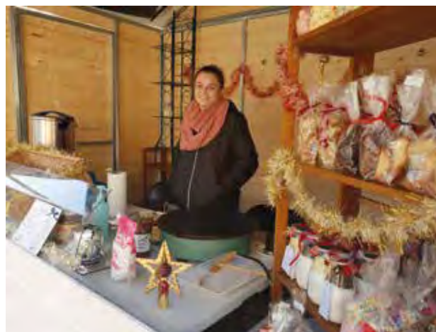
Saint-Gilles aussi a son marché de Noël ! Confiseries et objets originaux étaient proposés au Pavillon de la culture et du patrimoine les 14, 15 et 16 décembre derniers, grâce à l'association des peintres et artisans d'art.