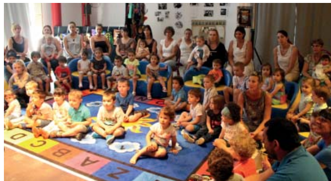
Les bébés et le très jeune public s'approprient aussi les sons, le langage et le sens des mots par le biais du conte.