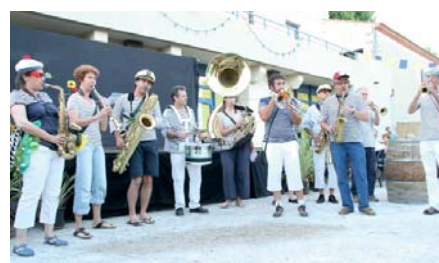
La fanfare BAKCHICH a distillé son répertoire aussi festif qu'hétéroclite pendant l'apéritif et la dégustation de tapas.