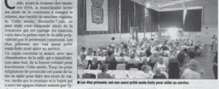
Les élus présents ont eux aussi profité malin pour aller au service.

Le rendez-vous gastronomique traditionnel toujours très prisé.