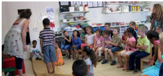
Les conteurs sont également allés à la rencontre du jeune public de la crèche et des écoles au sein de leurs propres établissements.