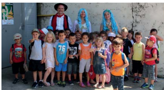
La chaleur n'a pas empêché un public très nombreux de profiter des spectacles, notamment ici «La petite sirène à la mode sêtoise» par la Cie BAO.