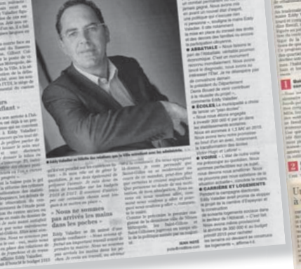
« J'ai toujours été très confiant... »

Nouveaux maires (9/12) L'édile UMP de Saint-Gilles se veut résolument confiant pour l'avenir de sa ville. Il est persuadé qu'elle va se moderniser.