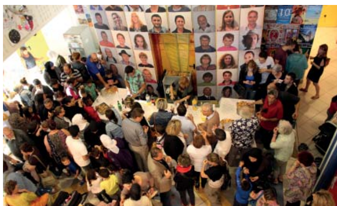
La soirée inaugurale a réuni les conteurs qui ont fait l'histoire du festival, devant un public fidèle et reconnaissant.