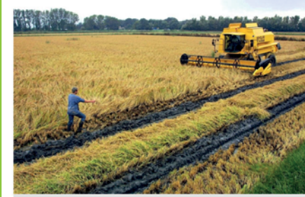
Rizières de Camargue.

La production de riz est en danger dans le delta du Rhône. C'est le message qu'on veut faire passer les riziculteurs camarguais. Le préfet de Languedoc-Roussillon et celui du Gard leur ont rendu visite lundi près de Saint-Gilles.