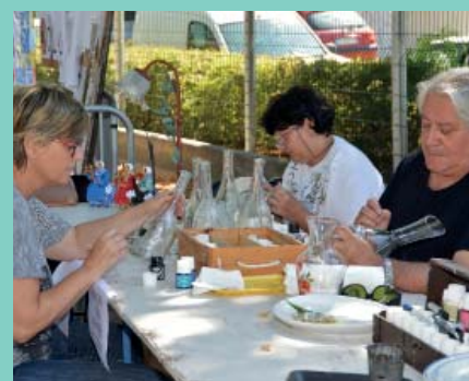
Quelques souvenir du forum 2014