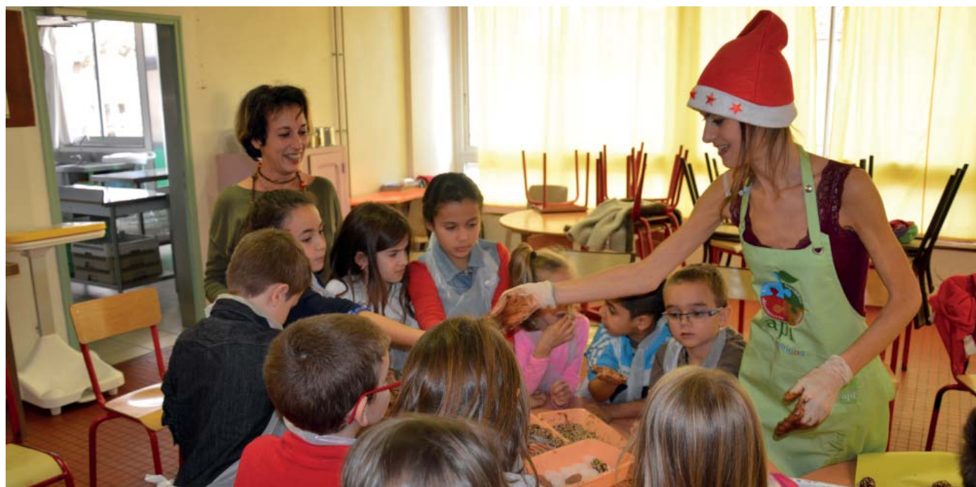
Atelier de confection de truffes au chocolat

Informations et inscriptions en Mairie – Service Enfance 04 66 87 77 66