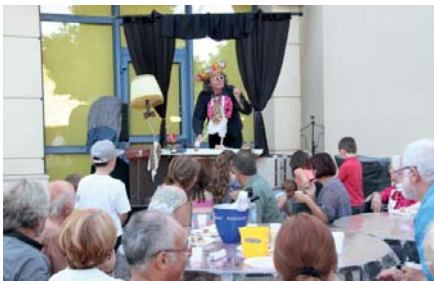
Encore un cadeau : l'excellent spectacle de marionnettes généreusement offert aux tout petits par la compagnie AZIMUTE