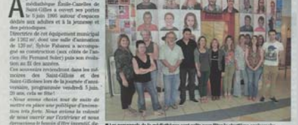
Le personnel de la médiathèque prêt pour faire la fête en nocturne.

Une rencontre aura lieu vendredi 5 juin autour de la musique, des chants, des récits et des visites guidées en nocturne.