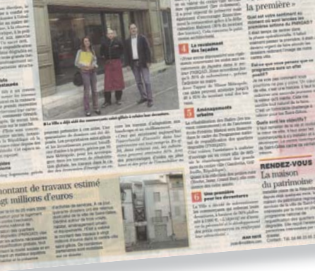
Un montant de travaux estimé à vingt millions d'euros

La Ville et ses partenaires ont choisi de s'engager financièrement pour le transformer.