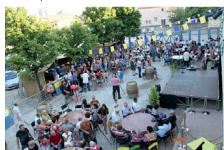
La cour de la médiathèque décorée par la Jeunesse saint-gilloise constitue un lieu de choix pour de nombreux échanges conviviaux entre les spectacles.