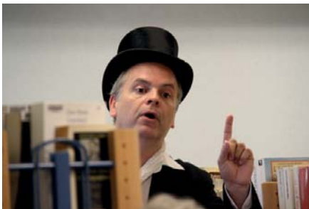
Le comédien Jordi CARDONE incarne Emile CAZELLES pour une visite des lieux pleine d'humour et de tendresse.