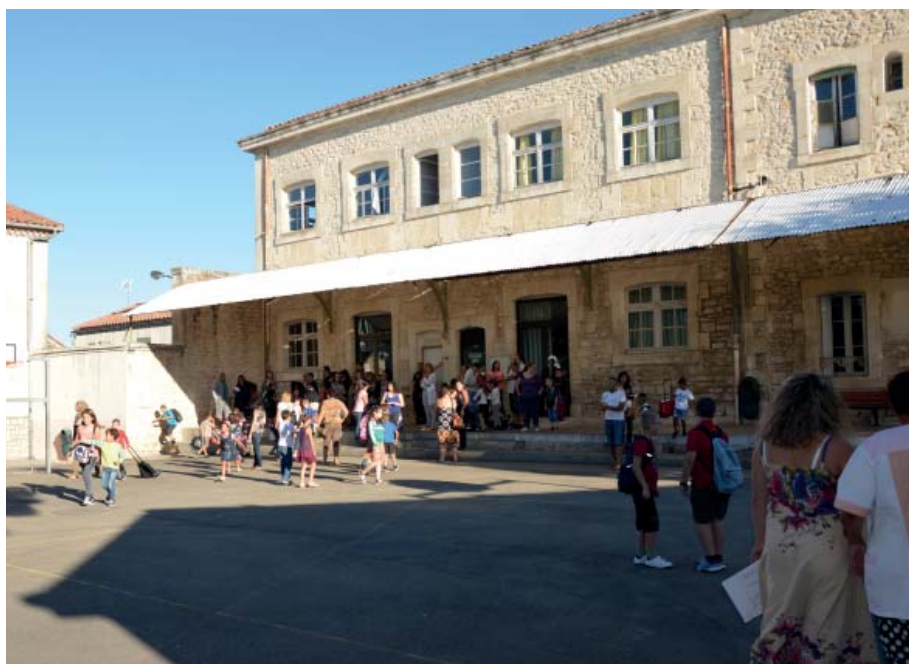
La cour actuelle de l'école Victor Hugo ...

En termes de sécurité , les travaux portent sur la structure même des ouvrages, à savoir isolement des classes du 1 er étage par rapport au couloir par la mise en œuvre de cloisons coupe-feu, mise en place de portes coupe-feu dans les classes, recoupement de la circulation au 1 er étage du bâtiment A, suppression de marches isolées secondaires, suppression et déplacement de coffrets électriques, réfection de la couverture de l'auvent de la terrasse du bâtiment B et mise en place d'un garde-corps, reprise des enduits de la façade du bâtiment A, fourniture de rideaux non inflammables. De même, il sera procédé