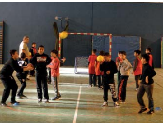
Tchouk ball : un nouveau sport exigeant découvert par les stagiaires pendant l'année

Chaque enfant ayant acquitté son droit d'entrée à la piscine pourra ainsi bénéficier de l'accueil d'un animateur et profiter de nombreuses activités ludiques.