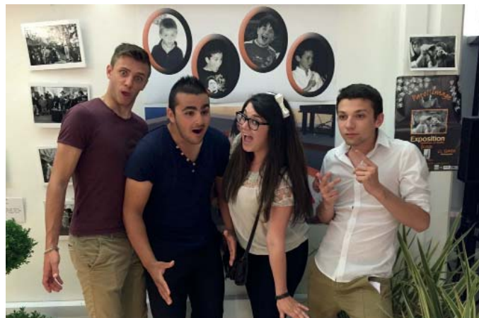
Les membres de l'association de la Jeunesse saint-gilloise, partenaire du festival, ont retrouvé leurs jeunes années au travers de l'exposition de leurs propres photos... de l'époque.