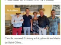
C'est le mercredi 5 juin qui fut présenté en Marie de Saint-Gilles. Lire La Suite »