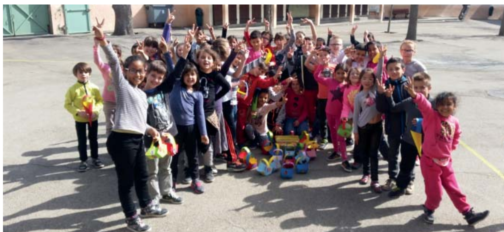
Un bel exemple d'apprentissage de la vie en collectivité

Les enfants peuvent être inscrits à la journée ou la ½ journée, avec ou sans repas.