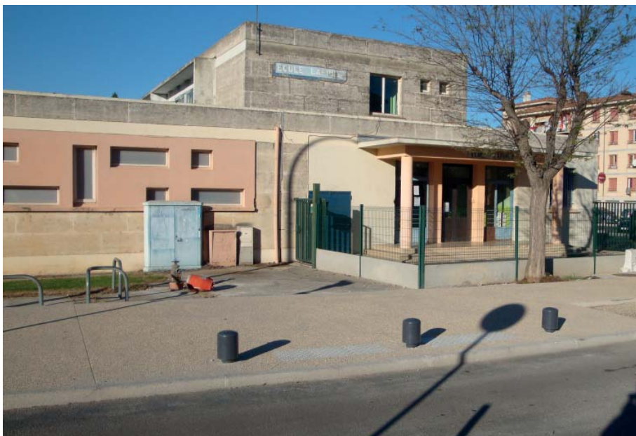
Entrée actuelle de l'école Laforet

Le chantier démarre le 6 juillet, pour que les travaux de bâtiments se déroulent pendant