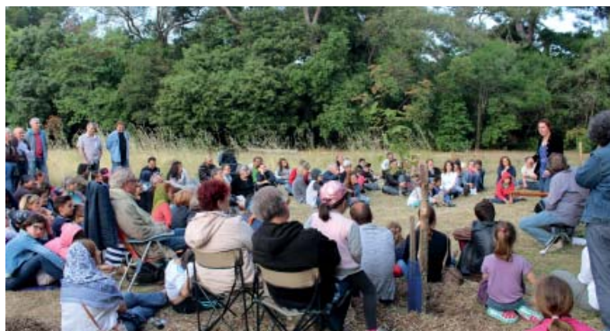
Un public familial a partagé un repas convivial, animé par un bal folk, dans le sublime parc du château d'Espeyran.