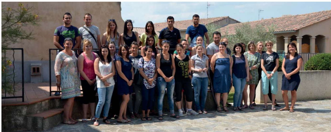
L'équipe d'encadrement des TAP

Les activités proposées contribuent à l'épanouissement des enfants, en développant leur curiosité, et s'inscrivent dans le projet pédagogique de chaque ALP (Accueil de Loisirs Péri-scolaires).