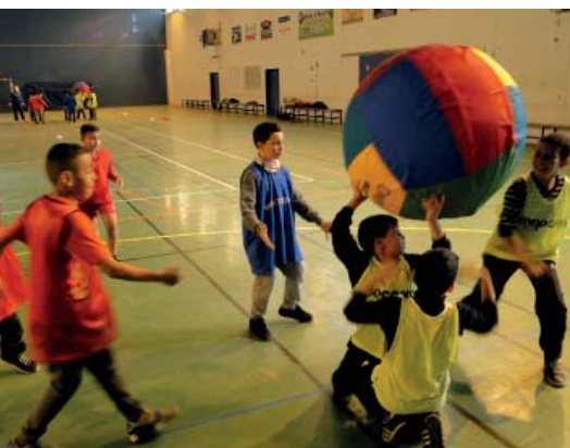
Kin ball : une nouvelle discipline enseignée lors de précédents stages