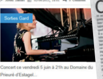
Concert ce vendredi 5 juin à 21h au Domaine du Pleureur d'Estapel... Lire La Suite »