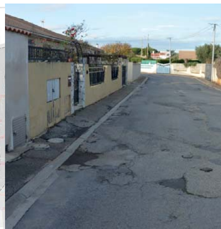
L'état actuel de la chaussée

Préalablement, la communauté d'agglomération Nîmes Métropole a programmé des interventions ponctuelles sur le réseau d'eau potable et d'eaux usées.