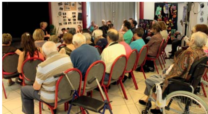
Les seniors ont, pour leur part, profité d'un spectacle tout public, en compagnie des plus jeunes et pour le plaisir de tous.