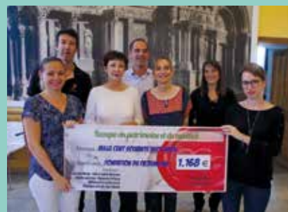
Remise de chèque, en mairie, en présence de la plupart des généreux donateurs.

C'est donc finalement un total de 2 563 € qui a été accumulé au bénéfice de cette action collective.