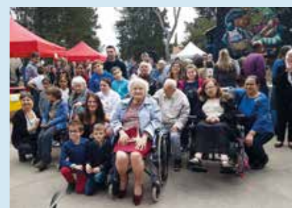
Les jeunes et moins jeunes auteurs Saint-Gillois récompensés.

La classe CM1-CM2 de l'école Jean Moulin et les résidents de l'EHPAD les Jonquilles, hors catégorie, pour leur œuvre « La malédiction de l'abbatiale ». Félicitations à tous ces talents, en herbe ou confirmés.