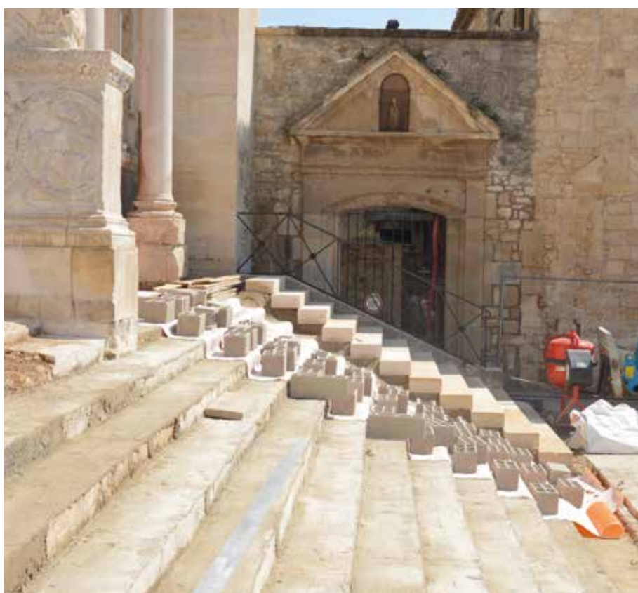
Progression du chantier d'emmarchement depuis le portail sud.

Un échafaudage pourra alors être remis en place afin de terminer la restauration des sculptures polychromes du portail nord avant la fin de l'année.