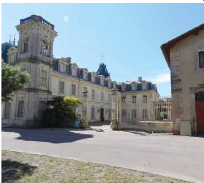
Le magnifique château d'Espeyran où seront accueillis les nouveaux Saint-Gillois

Les intéressés recevront une invitation personnalisée pendant l'été, par courrier postal.