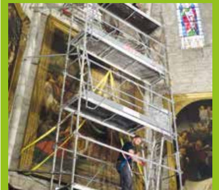
L'échafaudage reste en place le temps de la restauration du tableau