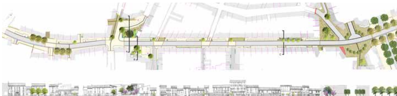
Périmètre de la phase 2 des travaux d'aménagement du centre-ville