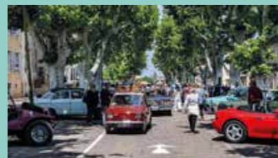
Les voitures ont pu être admirées entre la rue Gambetta et les arènes

Beaucoup d'amateurs ont savouré cette première concentration d'environ 120 belle voitures (anciennes et de prestige).