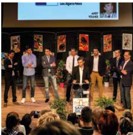
Matadors, empresa, ganadero et élus étaient réunis pour cette belle soirée.