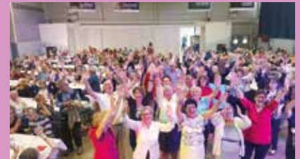
Les sourires en disent long quant à la qualité de l'animation...

330 personnes se sont réunies le 12 mai pour déguster l'excellent « misson » offert par le CCAS et cuisiné par nos agents des services techniques. Elus et personnel communal n'ont pas ménagé leur peine pour assurer la réussite de ce moment toujours aussi convivial, brillamment animé par le groupe Cruz animation.