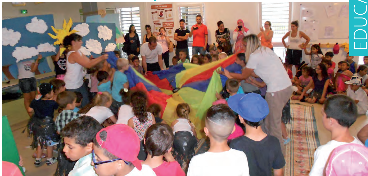
Spectacle de fin d'année de l'ALAE Jean Moulin'

Comme toutes les communes de France, Saint-Gilles doit appliquer, à la prochaine rentrée, la réforme des rythmes scolaires. Soucieuse de ne pas se mettre hors la loi, mais de ne pas non plus grever les finances de la commune, la municipalité a proposé de nouveaux horaires à l'ensemble des conseils d'écoles pour septembre prochain.