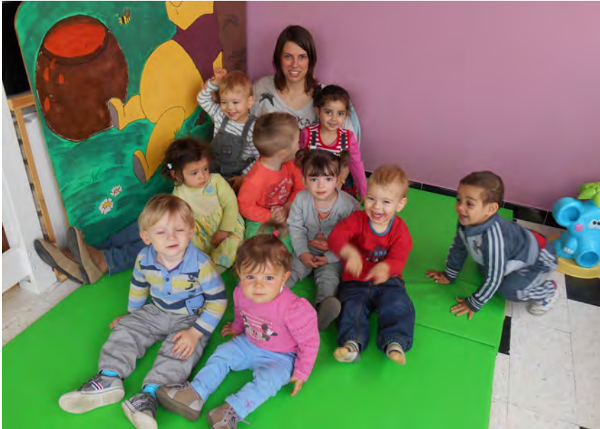
La bonne humeur règne chez les petits pensionnaires de l'île aux Enfants

Cette Maison d'Assistantes Maternelles regroupe 3 professionnelles agréées par le Conseil Général du Gard, qui accueillent vos enfants de 0 à 6 ans, à des horaires adaptés à vos besoins.