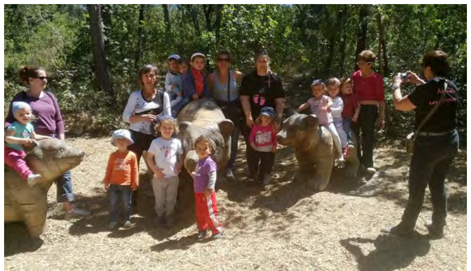
Une journée au zoo riche de souvenirs

Vide-grenier, loto et fête du citron de Menton sont autant d'événements à