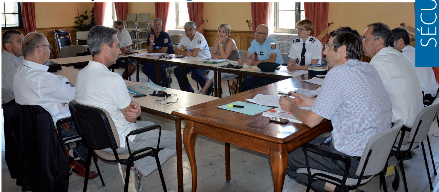
Elus saint-gillois, police municipale, gendarmerie, participation citoyenne, préfecture et référents de quartiers ont échangé le 11 juin en mairie sur ce projet.

Les démarches ont été engagées dès le mois d'avril avec les services de l'Etat (Préfecture et Brigade de Gendarmerie) pour un engagement de notre ville dans le dispositif de vigilance et de participation citoyenne conformément à la circulaire du 22 juin 2011.